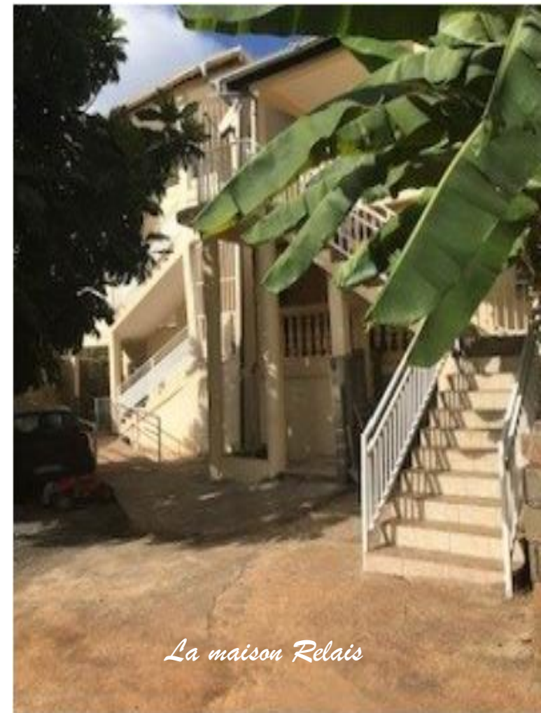
La maison Relais